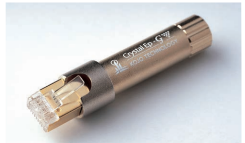
スタイリッシュな機能美デザイン

なかでもCrystal Ep-Gシリーズは、機能美デザインを持たせるため、一般的なRCAプラグの直径をベースに考案。非常にスリムでスタイリッシュな形状と、金/Niメッキによるツートンカラーで構成され、モデル名およびブランドトレードマークも主張を抑えたホワイト系シルク印刷でデザインされています。3ピースで構成される部材は全て真鍮削り出し仕様。これにより振動抑制効果も同時に実現しています。各種プラグは信頼と実績の金メッキ、仮想アース部本体およびキャップはサンドブラストによる梨地処理が施され、金属導体の有効表面積を拡大しつつデザインとの融合が図られています。